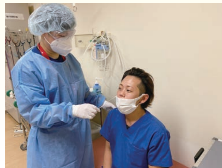
鼻咽頭ぬぐい液によるPCR検査

感染対策をしっかり行っても、新型コロナウイルスのクラスターが発生してしまった場所もありますが、当院では皆様のご協力もあり、今のところ発生しておりません。引き続き感染対策へのご協力をお願いします。